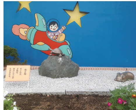
兎(うさぎ)と亀(かめ) すぐれた才能は、努力してこそ生かされる。