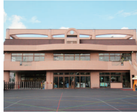
園舎・園庭(全天候型弾性舗装)